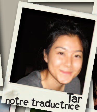
Tar notre traductrice