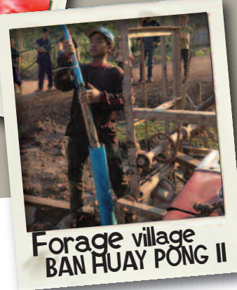
Forage village BAN HUAY PONG II